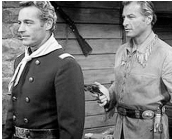
1964 LES CAVALIERS ROUGES (Old Shatterland) d'Hugo Fregonese avec Lex Barker