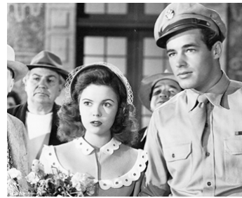
1947 SÉRÉNADE À MEXICO (Honeymoon) de William Keighley avec Shirley Temple