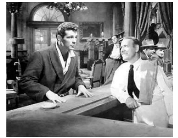
1948 L'ARCHANGE DE BROOKLYN (Texas, Brooklyn and Heaven) de William Castle