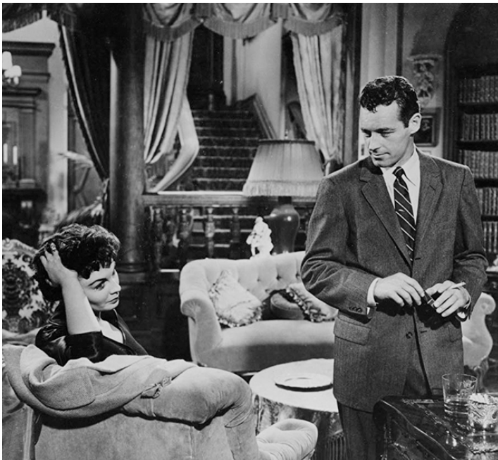
1956 L'IMPUDIQUE (Hilda Crane) de Philip Dunne avec Jean Simmons