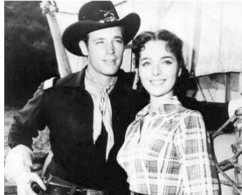
1954 LA POURSUITE DURA SEPT JOURS (The Command) de David Butler avec Joan Weldon