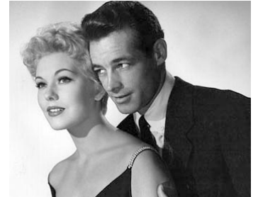
1955 ON NE JOUE PAS AVEC LE CRIME (Five against the house) de P. Karlson avec Kim Novak