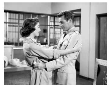
1956 AU SEUIL DE L'INCONNU (On the Threshold of Space) de Robert D. Webb avec Virginia Leith