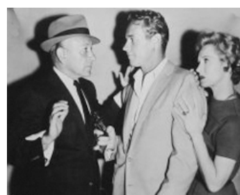
1959 JET OVER THE ATLANTIC de Byron Haskin avec George Raft, Virginia Mayo