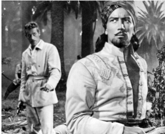
1964 LE LÉOPARD DE LA JUNGLE NOIRE (Il leopardo di Sarawak) de L. Capuano avec Ray Danton