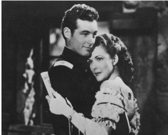
1953 LA CHARGE DE LA RIVIÈRE ROUGE (The Charge at Feather River) de G. Douglas avec Vera Miles