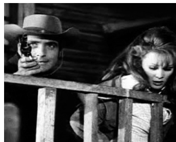
1967 BANG BANG KID (Il Bang Bang Kid) de Giorgio Gentilil avec Sandra Milo