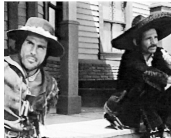
1965 LES CINQ DE LA VENGEANCE (I cinque della Vendetta) d'Aldo Florio