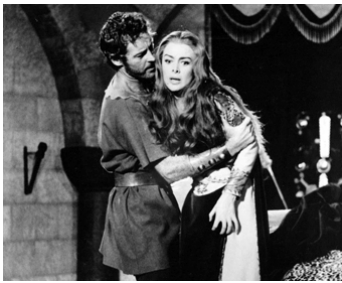
1961 LE GLAIVE DU CONQUÉRANT (Rosmundo e Alboino) de C. Campogalliani avec E. Rossi-Drago