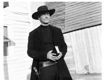
1970 LE COLT DU RÉVÉREND (Reverendo Colt) de Leon Klimovsky