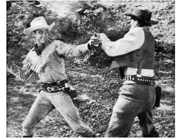
1952 THE GHOST OF CROSSBONE CANYON de Frank McDonald avec Mike Ragan