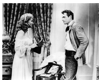
1958 LA FEMME AU FOUET (Bullwhip) d'Harmon Jones avec Rhonda Fleming