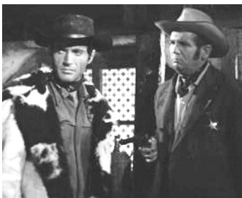
1967 LE RETOUR DE DJANGO (Il Figlio di Django) d'Oswaldo Civirani avec Daniele Vargas