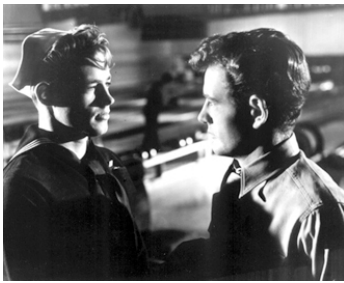
1944 DEPUIS TON DÉPART (Since you went away) de John Cromwell avec Robert Walker