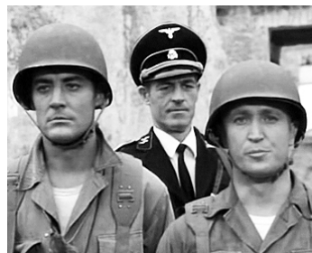
1969 L'OTAGE DU III e REICH (Comando all'inferno) de J. L. Merino avec Carlos Quincey, E. Avila