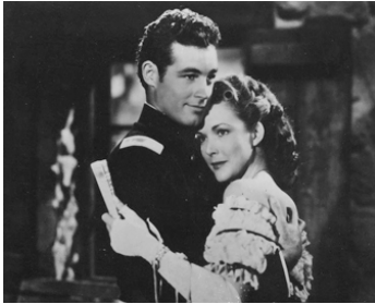
1949 LA RIVIÈRE DES MASSACRES (Massacre River) de John Rawlins avec Carole Matthews