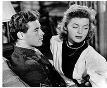
1946 JUSQU'À LA FIN DES TEMPS (Till the end of time) d'Edward Dmytryk avec Dorothy McGuire