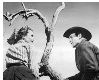
1956 REPRÉSAILLES (Reprisal !) de George Sherman avec Kathryn Grant