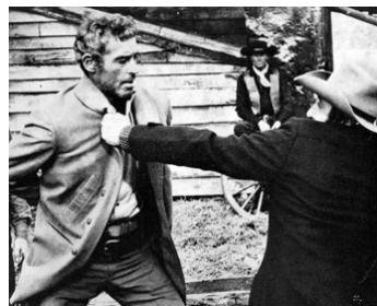
1968 RINGO NE DEVAIT PAS MOURIR (I lunghi Giorni dell'odio) de Gianfranco Baldanello