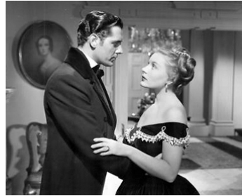
1951 LE ROCHER DU DIABLE (Drums in the deep South) de W. C. Menzies avec Barbara Payton