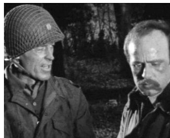
1969 LES GUERRIERS DE L'ENFER (I Diavoli della Guerra) de Bert Albertini avec Renato Romano