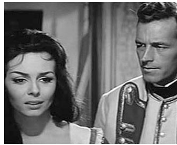
1963 L'ÎLE AUX FILLES PERDUES de Domenico Paolella avec Michèle Mercier