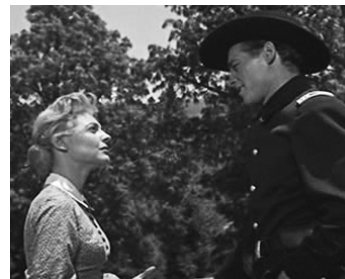
1955 LA CHARGE DES TUNIQUES BLEUES (The last Frontier) d'A. Mann avec Anne Bancroft