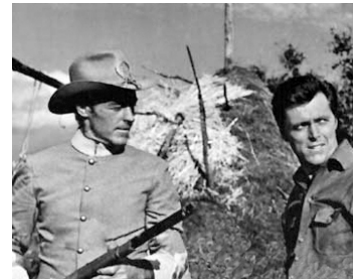
1967 SEPT WINCHESTER POUR UN MASSACRE d'Enzo G. Castellari avec Edd Byrnes