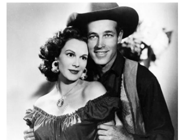
1956 LA MONTAGNE MYSTÉRIEUSE (The Beast of Hollow Mountain) d'I. Rodriguez avec P. Medina