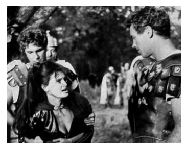
1961 L'ESCLAVE DE ROME (La Schiava di Roma) de Sergio Grieco avec Rossana Podesta